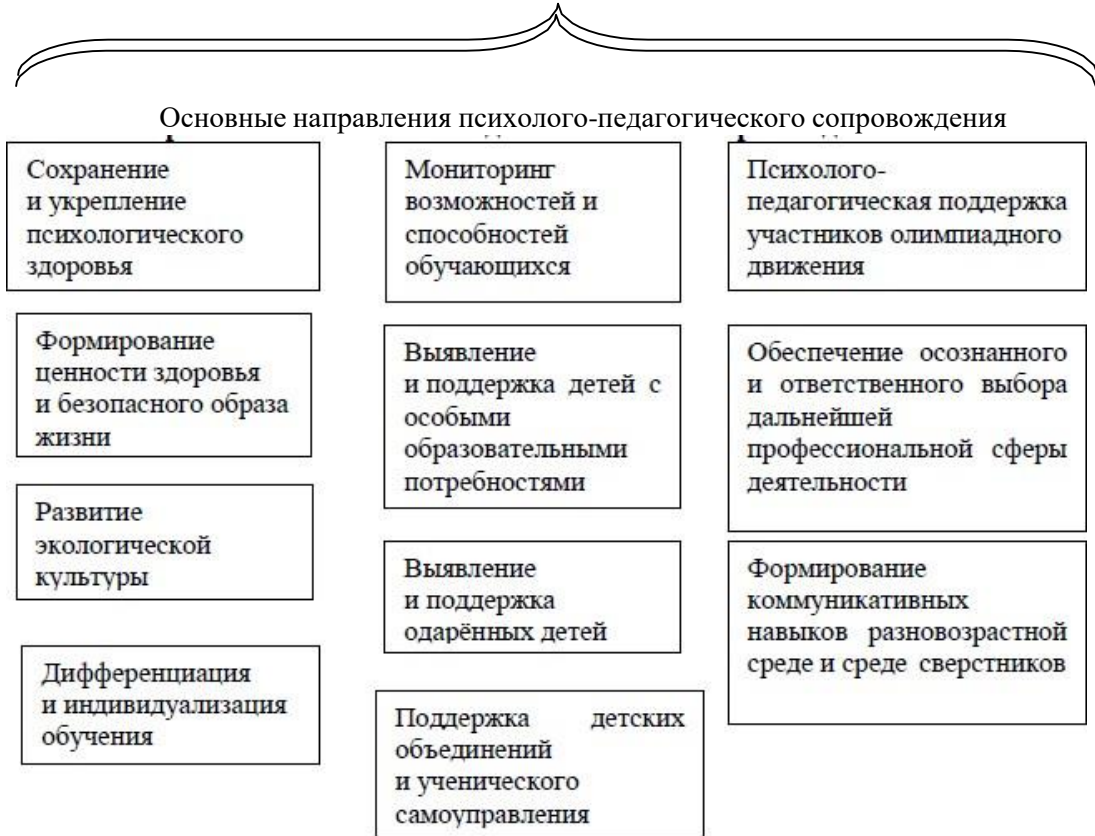
Структура взаимодействия социально-психолого-педагогической службы с участниками образовательного процесса